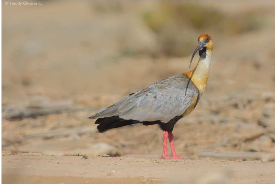
Fotografía de Theristicus melanopus