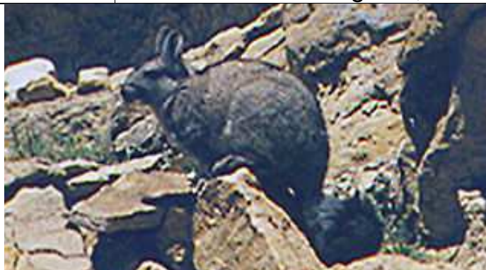
Fotografía del Lagidium wolffsohni , Patagonia, enero 2013.