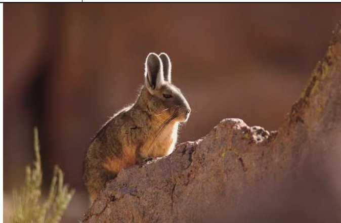
Fotografía del Lagidium viscacia (Claudio Almarza)